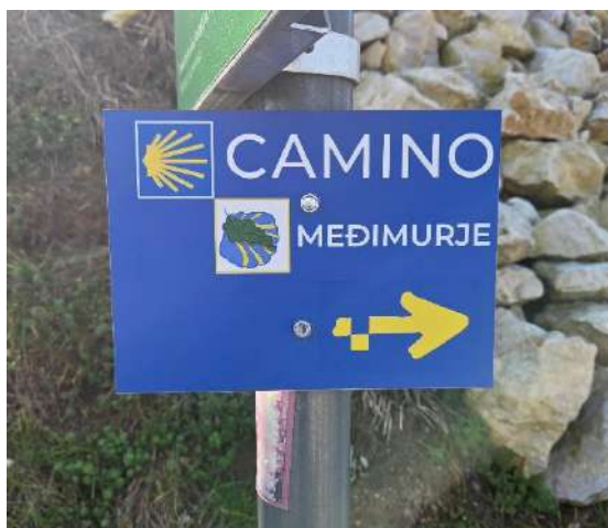
Camino Međimurje oznaka kod Vidikovca Maderkin breg

U nedjelju, 2. ožujka 2025. godine održan je tradicionalni Štrigovski fašenk. Program je započeo fašničkom povorkom kroz Štrigovu, nakon čega je u Domu kulture Štrigova održan prigodan kulturni program uz sudjelovanje brojnih fašničkih skupina i posjetitelja. Dana 4. ožujka 2025. godine održana je 1. sjednica Turističkog vijeća Turističke zajednice Općine Štrigova. Na sjednici je razmatran i usvojen zapisnik s prethodne sjednice, prihvaćen je Poslovnik o radu Turističkog vijeća za 2025. godinu, raspravljen je prijedlog Godišnjeg izvješća o izvršenju programa rada Turističke zajednice Općine Štrigova za 2024. godinu te Godišnji izvještaj o radu Turističkog vijeća za 2024. godinu.